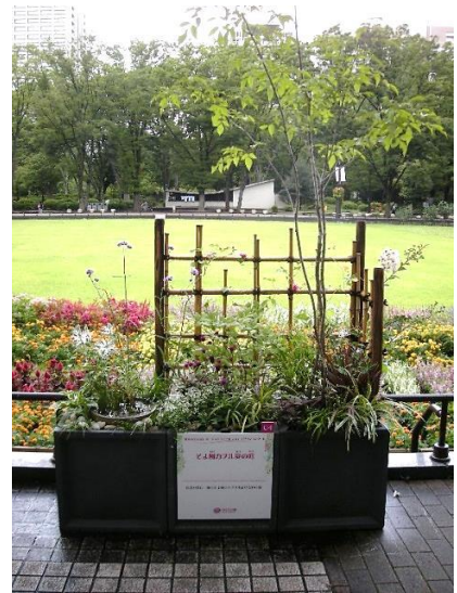
昨年のコンテナガーデン部門作品