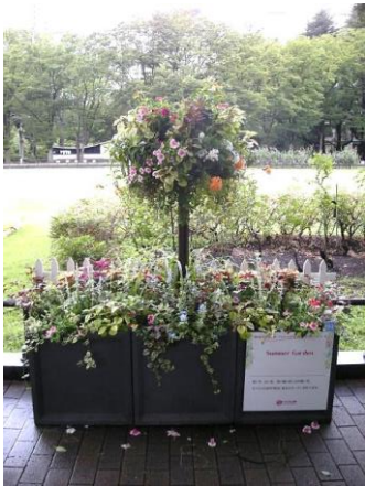
昨年のスタンディングバスケット付コンテナガーデン部門作品