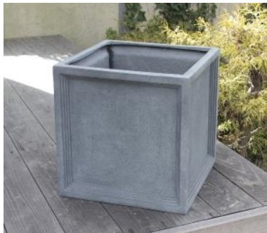
【使用器材】 グリーンポット LL プリティッシュUP キューブ