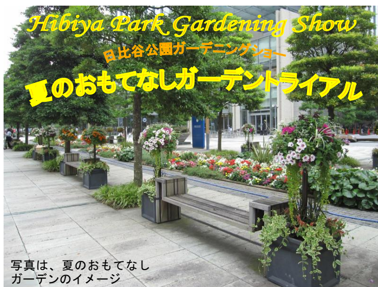
写真は、夏のおもてなし ガーデンのイメージ

首都東京がガーデンシティ(庭園都市)として世界の人々を「おもてなし」とともに、都市の花と緑のあり方を日比谷公園から広く世界に発信する、日比谷公園ガーデニングショーが、今年も10月下旬に開催されます。