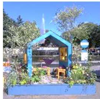
「実のなる停留所」 E&Gアカデミー東京校