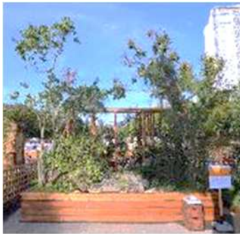
「円居」 有限会社 季織苑