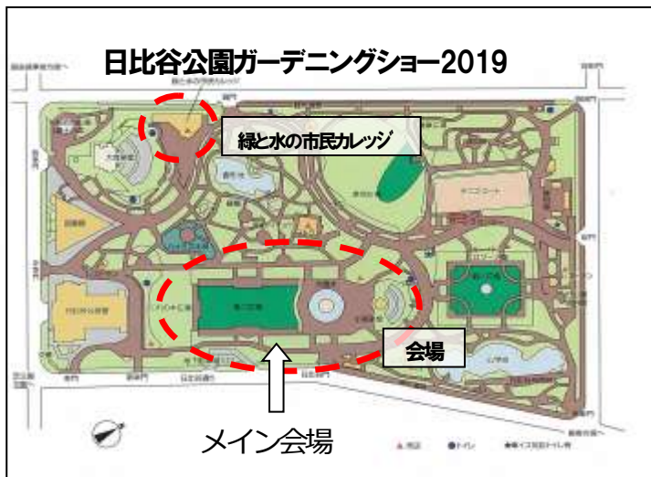
日比谷公園近辺、公共機関位置図