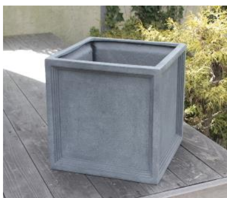
【使用器材】 グリーンポット LL プリティッシュPキューブ