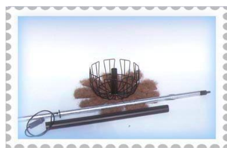
【使用器材】 伊藤商事 スタンディングミニ(SB-35-OS)