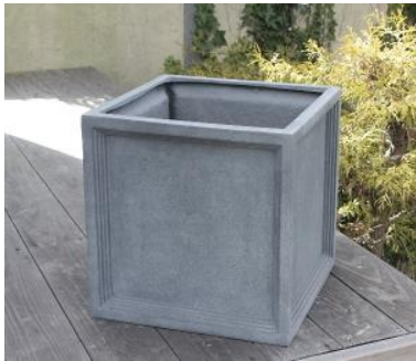
【使用器材】 グリーンポット LLブリティッシュPキューブ